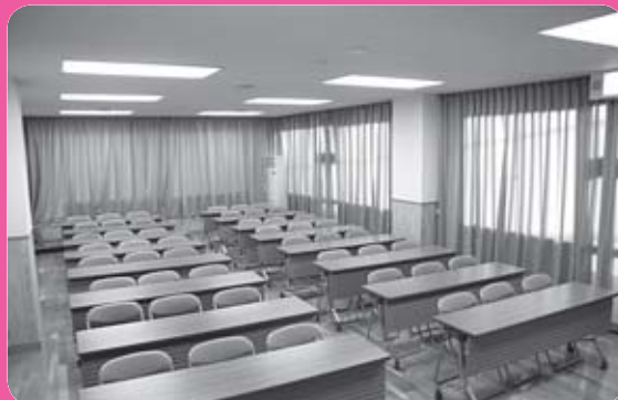
2階 会議室 (定員51名)