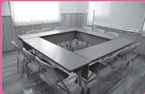
1階 活動室2 (定員12名)