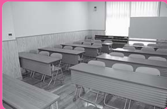
1階 活動室1 (定員30名)