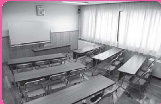
2階 活動室3 (定員24名)