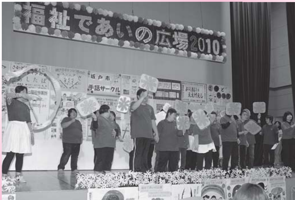
「福祉であいの広場」今年も皆様のご来場お待ちしております<詳細 5.6 ページ>