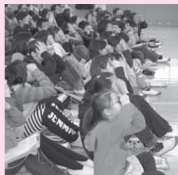
視野が狭い体験。集中して話を聞いていました。