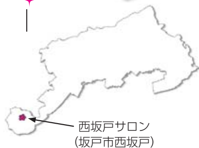
西坂戸サロン (坂戸市西坂戸)