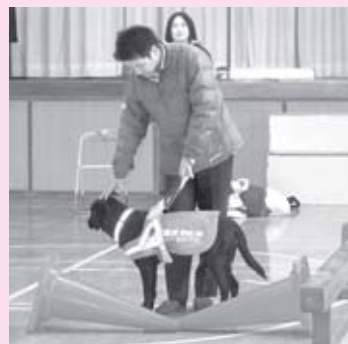
危険物や幅が狭い通路、段差の前では、止まって危険を知らせます。

外を歩いている時は 皆さんへお願い 盲導犬がハーネス（胴輪）をつけている時は、仕事中です。そんな時は、盲導犬に触ったり、声をかけたり、食べ物を与えたり、目を合わせることもやめてください。