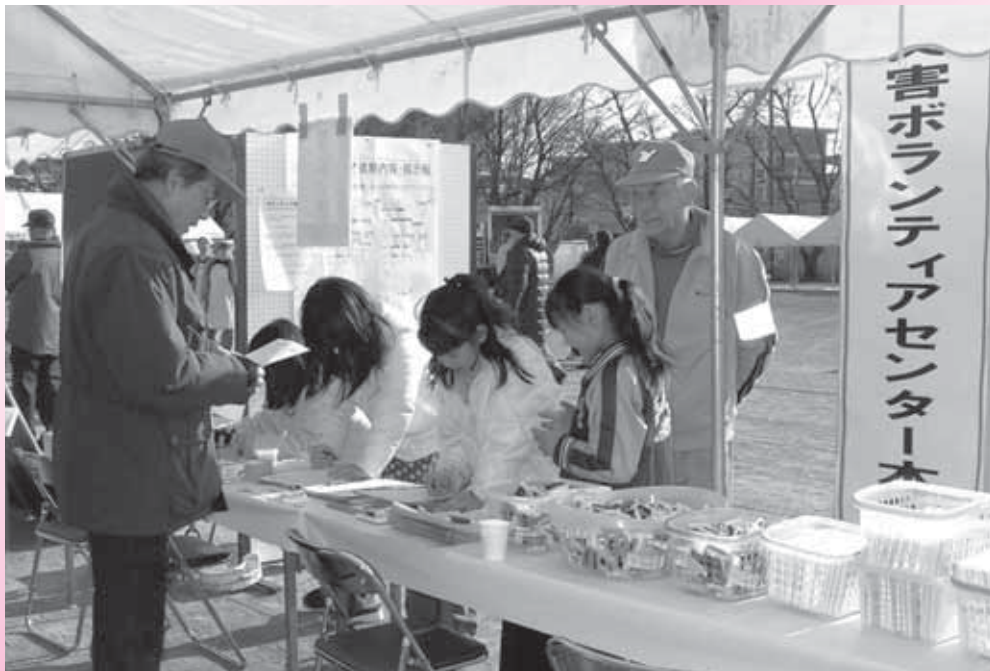
「坂戸市総合防災訓練」会場にて“災害ボランティアセンター設置訓練”を行います。 <詳しくは、2.3ページにて>