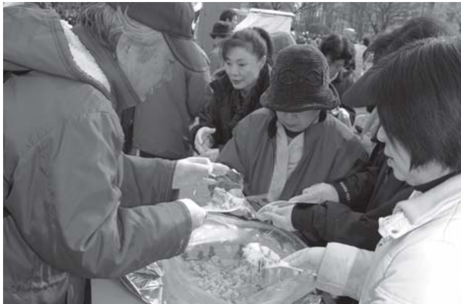
▲アルファ米 炊き出し 体験の様子